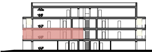
UNITA' B6 – PIANO PRIMO