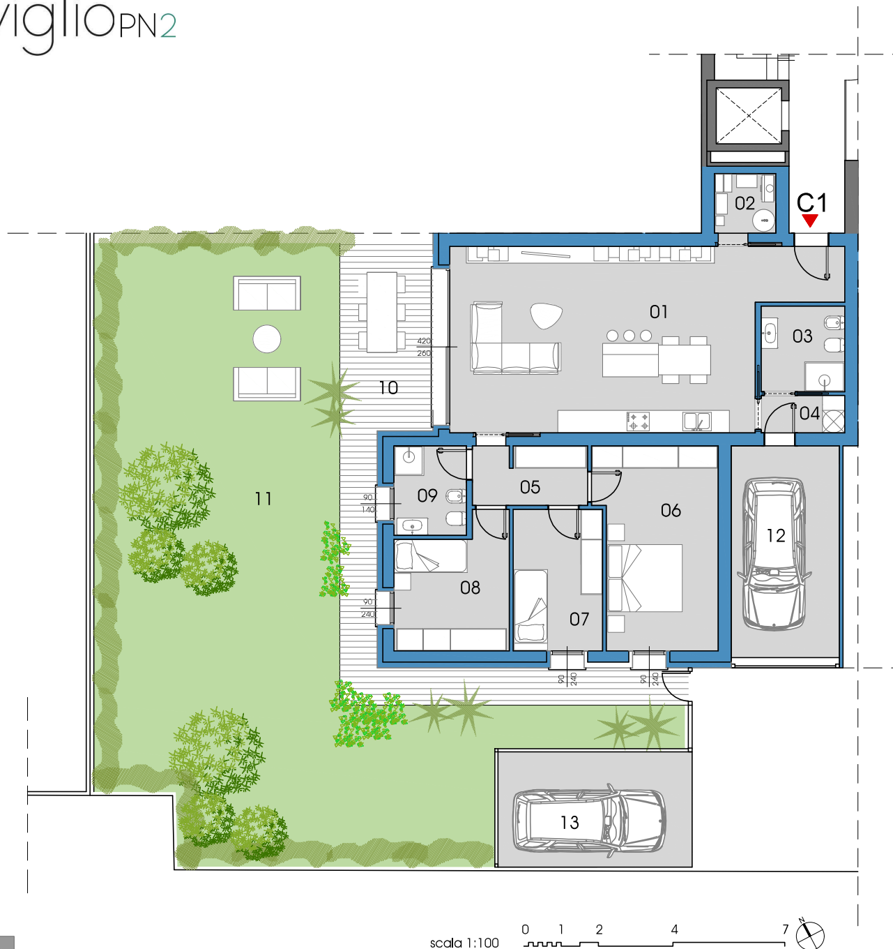
UNITÀ C1 _ PIANO TERRA